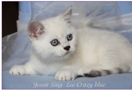
Britisch Kurzhaar silver tabby point