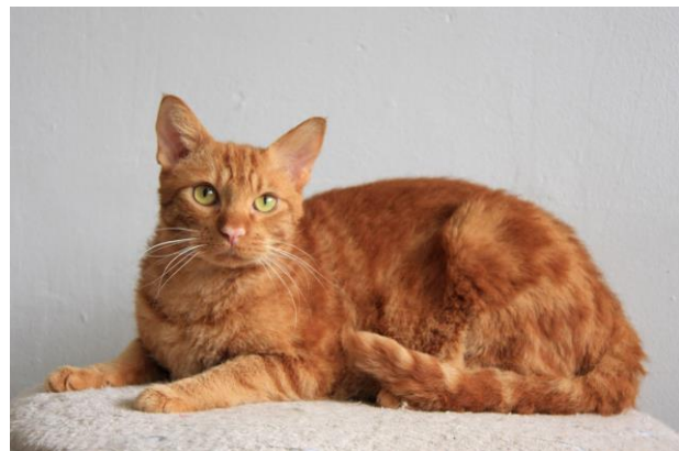
La Perm Kurzhaar Ike