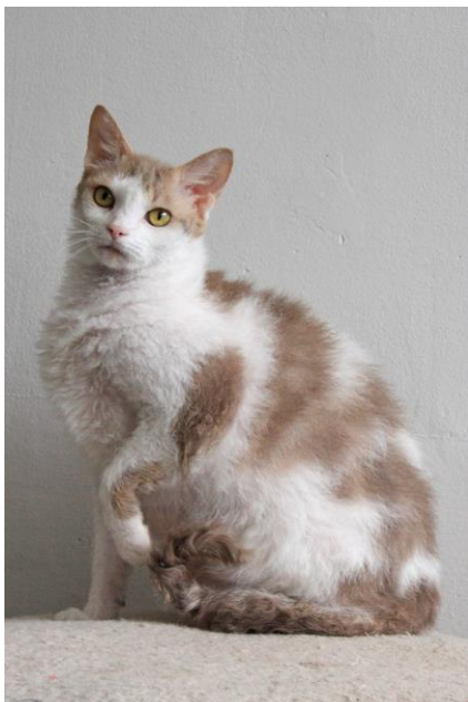
La Perm Kurzhaar Bonita