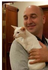
OSH weiss 61/63/64